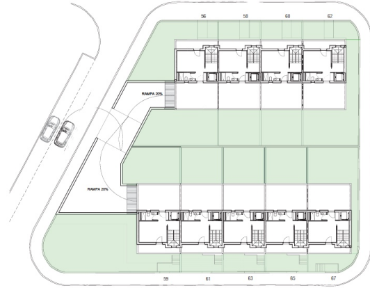
PLANTA SEGONA ↻